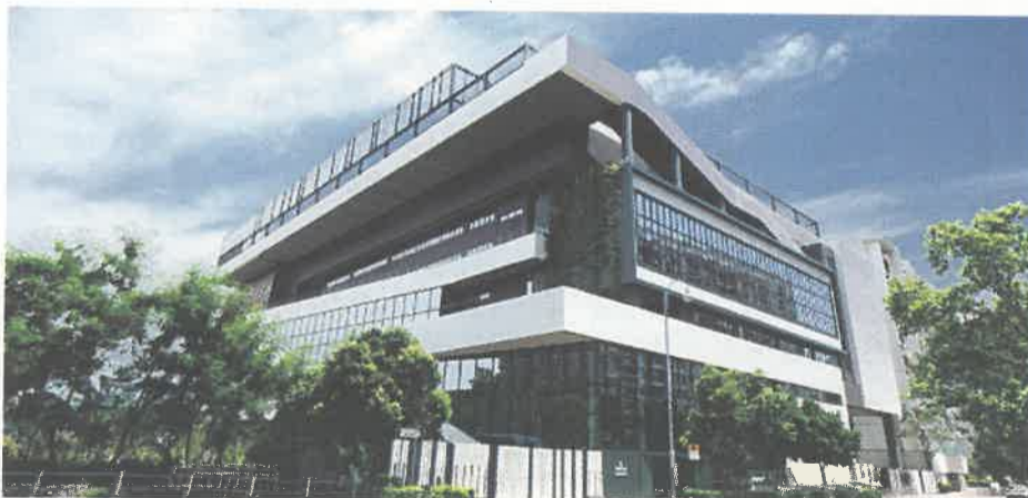
香港墨爾文國際學校設小學及中學部，分享坐落於大埔科進路樓高七層的校舍。